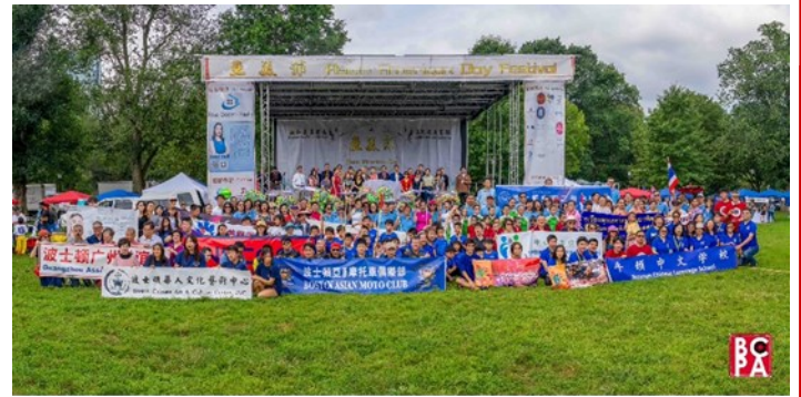
亞美節中心大舞臺，及為商家配備的帳篷

波士頓市中心公園內露天會場，活動可用面積200000ft 2 （約17800m 2 ）。會場中央配有40*30ft帶背景板露天舞臺，專業音響團隊全天候服務，可供相應合作商家在開幕式致辭、宣傳。現場配備65-90個10*10ft帳篷，可供商家攤位使用。現場規劃單個攤位最大可達到40*10ft。同時，我們還為餐飲類商家配備電源及消防許可申請，可在2024年8月10日前向我們申請。