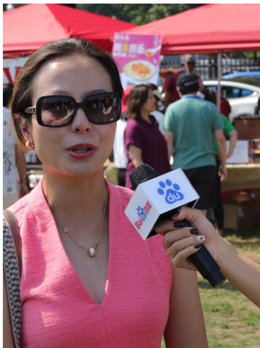
百度網記者採訪亞美節合作商家、主辦方