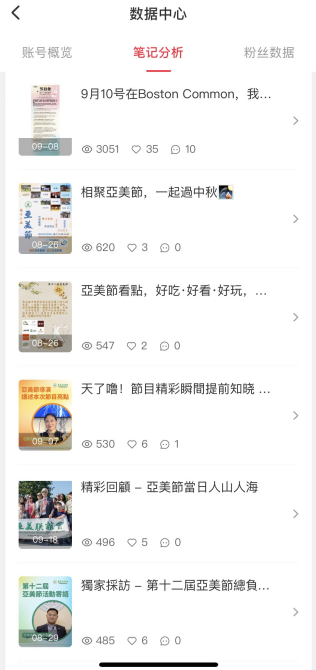
亞美會小紅書APP第十二屆亞美節期間流覽量