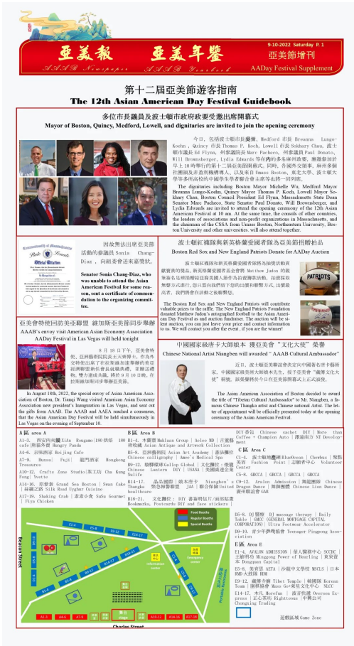
第十二屆亞美節現場特刊

在亞美節活動現場，我們將會向所有遊客派發可作為導覽手冊的《亞美報現場特刊》（2023年線上及紙質版投放數量5000份以上）。所有商家按照贊助等級，可獲得對應大小的版面，用於投放自己的宣傳廣告。同時，亞美會下屬微信公眾號平臺（活動推送文章單篇閱讀可達500以上），小紅書賬號（活動推送文章單篇閱讀可達500以上），及Facebook和Twitter等平臺，都將同步推送相應合作商家的廣告或宣傳視頻。